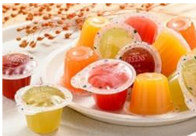
カゴメグリーンス