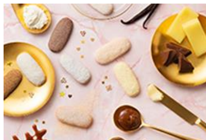
ハッピーターンズ