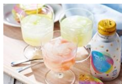
発酵カルピス(R)パーラー