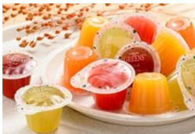
カゴメグリーンス